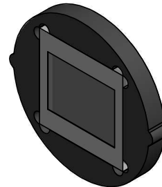
DETAIL A SCALE 100 : 1

NOTE : ALL DIMENSIONS ARE IN MILLIMETERS